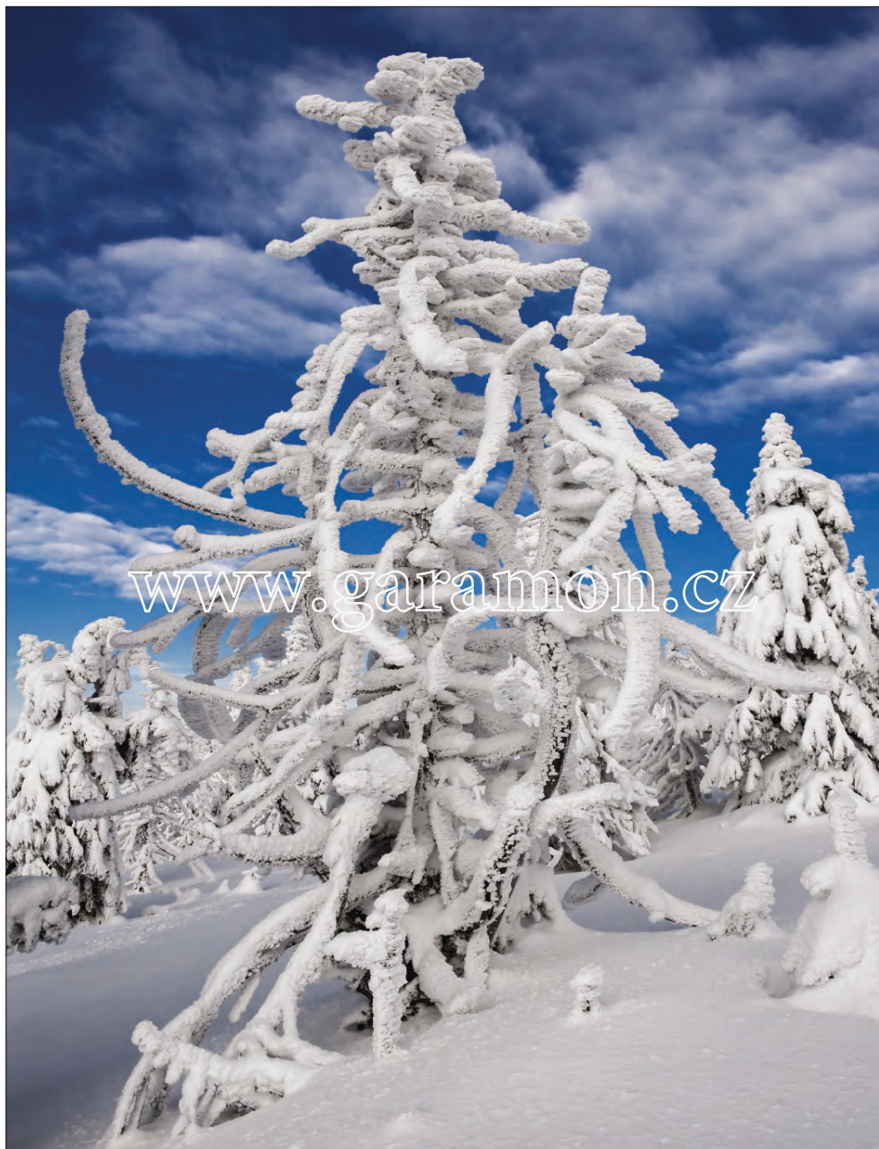
Labská louka (2013) Stromy mám, aby součástí fotografického obrazu, moc rád. Dávají snímku vjem prostoru a řád. Zejména v zimě působí pod tíhou čerstvého sněhu klidným, smířlivým dojmem. Šel jsem z Vosecké boudy ke Kottli a narazil na tohoto dynamického „hyperaktivního“ jedince. Ó jak mně byl blízký...