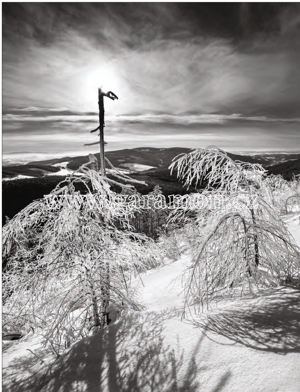
Horní Lysečiny - Pomezní hřeben (1993) Mému srdci nejmilejší kout východních Krkonoš. Po nejen kalamitním odlesnění Pomezního hřebene zajišťovala erozní stabilitu rychle rostoucí bříza. Nádherná, jemná stafáž v prvním plánu zimních motivů. Dnes již svahy zpět ovládly smrkové porosty, které na dlouhá léta zatáhly oponu dalekým výhledům.