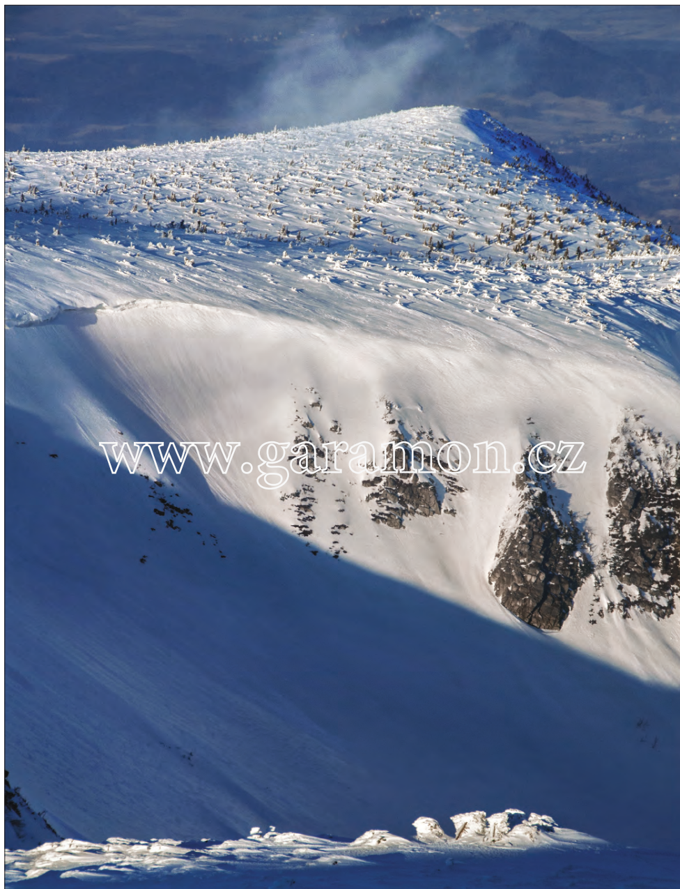
Kopa ze Studniční hory (2008) V třeskutém mrazu a docela svižném větru jsem na běžkách „vystromečkoval“ na Studniční horu právě včas. Padvečerní slunce nejen že ještě nasvětlovalo horní část Úpské jámy, ale i olízlo nenápadný a jindy bezvýznamný hřebínek navátého sněhu v popředí. To dalo smysl pro vznik této fotografie.