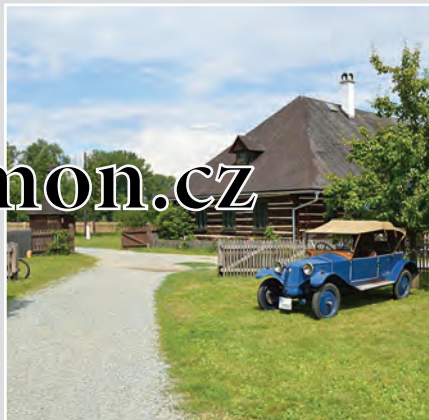
Podorlický skanzen Krňovice soustřeďuje architektonické a technické památky regionu Královéhradecka, podhůří Orlických hor a Podkrkonoší.