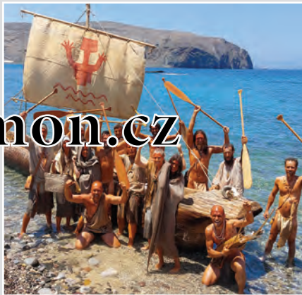
Experimentální archeologové z Archeoparku Věstary se loni 19. června vydali ve vlastnoručně vydlabaném monoxylonu, replice pravěkého člunu, Egejským mořem. Po 500 km dorazili do cíle na Peloponésu.