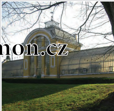
Zámek v Kopidlně je obklopen anglickým parkem se zimní zahradou, fíkovnou, oranžerií a skleníky - je dodnes funkční technickou památkou.