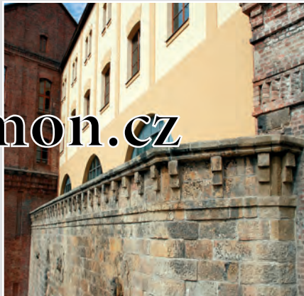
Kamenné a cihlové římsy jsou typickým stavebním prvkem budovy bývalého hradeckého pivovaru.