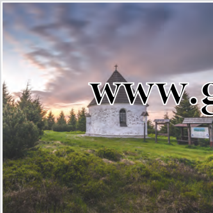
Kunštátská kaple Navštívení Panny Marie na hřebenové cestě Orlických hor.