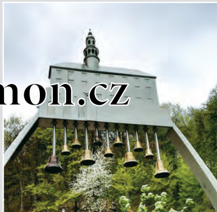
Zvonkohru na Karlově náměstí v Náchodě tvoří přes čtyři metry vysoký oblouk připomínající bránu. Zvonkohra vyhrává na jedenáct zvonků lidové, umělé písně i koledy čtyřikrát za den.