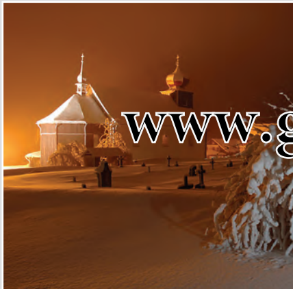
Barokní kostel svatého Petra a Pavla v Dolní Malé Úpě je jedním z nejvýše položených svatostáneků v Čechách.