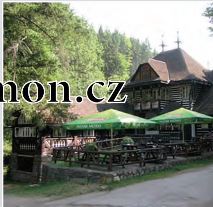
Kulturní památka turistická chata Peklo neboli Bartoňova útulna, postavená dle návrhu Dušana Jurkoviče, stojí na místě historického vodního mlýna na řece Olešence nad soutokem s Metují.