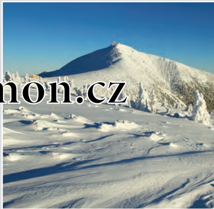
Hora Sněžka, se svými 1603 metry nadmořské výšky, je nejvyšším vrcholem nejen Krkonoš, ale i celých Čech.