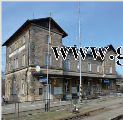
Ostroměř je železniční stanice v okrese Jičín. Leží na neelektrizovaných jednokolejných tratích Chlumec nad Cidlinou – Trutnov a Hradec Králové – Turnov. V roce 2007 získalo ocenění Nejkrásnější nádraží roku.