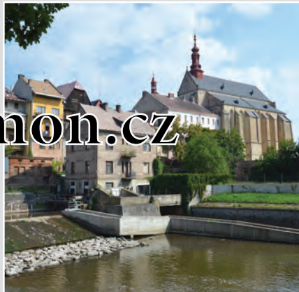
Město Jaroměř leží na soutoku řek Labe, Úpy a Metuje. Historickému náměstí dominuje jedna z nejvýznamnějších památek východních Čech kostel svatého Mikuláše.