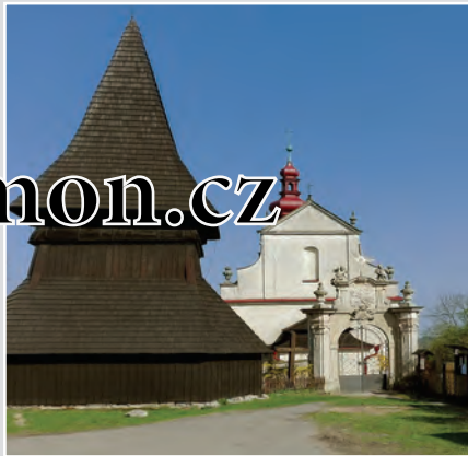
Kostel Nanebevzetí Panny Marie v Chotěborkách. Z původní gotické architektury je zachován portál a dřevěná gotická zvonice. Malebná vesnička je vesnickou památkovou zónou od roku 2005.