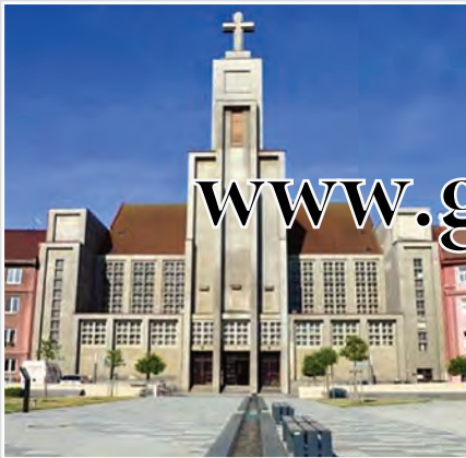
Kostel Božského Srdce Páně, jeden z prvních moderních katolických svatostánků. Architekt Bohumil Sláma v tomto hradeckém projektu představil jeden z vrcholů snahy o modernizaci církevní architektury.