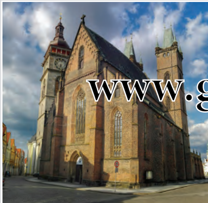
Pozdně gotická cihlová katedrálka Svatého Ducha v Hradci Králové spolu s renesanční Bílou věží tvoří charakteristickou siluetu města. Z Bílé věže je úchvatný daleký rozhled do polabské krajiny.