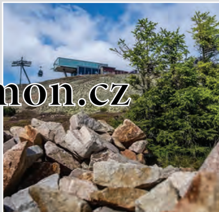
Smrk ztepilý na jihovýchodním úbočí Sněžky v nadmořské výšce 1563 metry je nejvyšše rostoucím stromem České republiky.