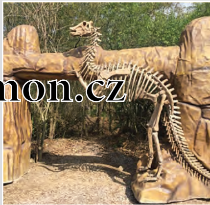
Fajnpark u Chlumce nad Cidlinou, to je zábava, ale i poučení pro celé rodiny. Hopsáلكov, Dinoprales, Stezka bosou nohou, Zookoutek, Indiánov a další tématické akce vydají na celý den.