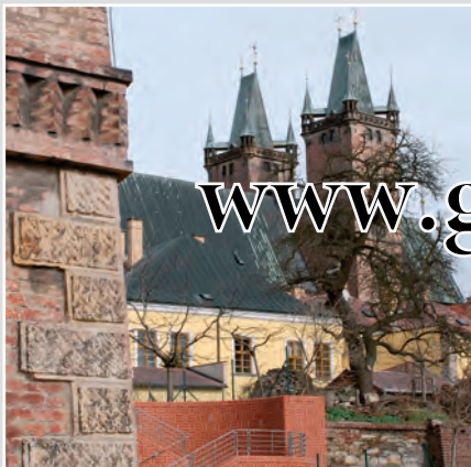
Pohled na terasy pod kanovníckými domy na pozadí věží katedrály svatého Ducha.