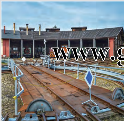
Muzeum Výtopna Jaroměř vás vrátí do doby, kdy železnici vládla pára. Naleznete zde i lokomotivy, které pamatují ještě čisárpána, ale i různé osobní a nákladní železniční vagony a další kolejová vozidla.