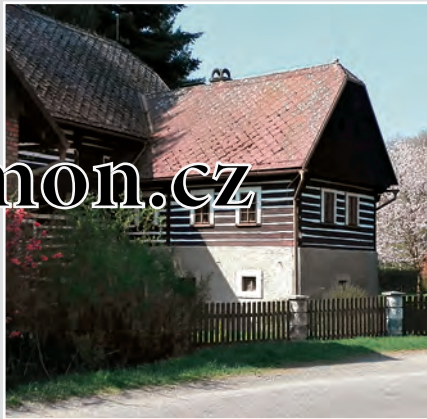
Havlův vodní mlýn ve Velehrádku stojí na Řečickém potoce, poblíž obce Lanžov. Je chráněn jako nemovitá kulturní památka České republiky.