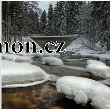
Zemská brána na Divoké Orlici. Kamenný most byl postaven v letech 1900 až 1903.