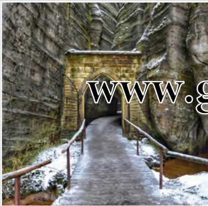
Pseudogotická branka byla vybudována v roce 1839. Dříve označovala vstup do Adršpašského skalního města.