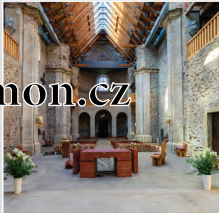
Kostel, který dostal druhou šanci. Úžasné místo, které nemá obdoby. Tak nějak se o kostelu Nanebevzetí Panny Marie v Neratově hovoří.