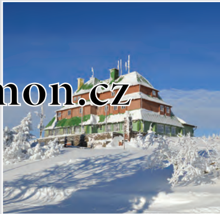
Pod vrcholem Šerlich v Orlických horách v nadmořské výšce 1019 m se nachází mezi turisty oblíbená Masarykova chata, postavená v roce 1924–1925.