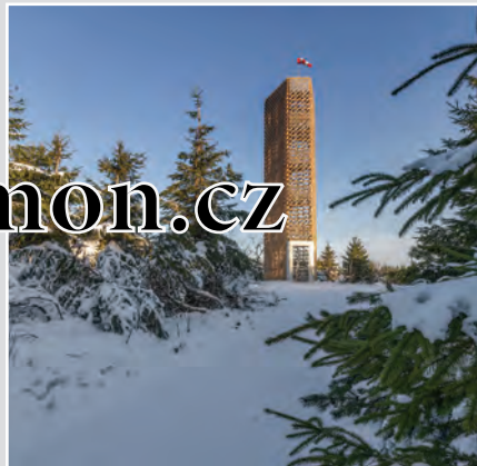
Velká Deštná s nadmořskou výškou 1116 m n. m. je nejvyšší horou Orlických hor. Na jejím vrcholu stojí rozhledna měřící téměř 18 metrů. Vyjdete-li 96 schodů, naskytnou se vám výhledy na okolní hory i do podhůří.