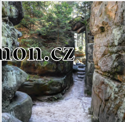
Stolová hora Ostaš v Broumovské vrchovině převyšuje okolní krajinu o 250 m. Nabízí rozmanité pískovcové útvary tvořící skalní bludiště, které baví děti i dospěláky. Ostaš je též útočištěm řady dravých ptáků.