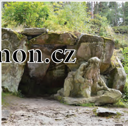
Braunův Betlém je soubor soch a pískovcového reliéfu vytvořený proslulým barokním umělcem Matyášem Bernardem Braunem. Byl vytesán a ponechán ve volné přírodě v Novém lese nedaleko Kuksu.