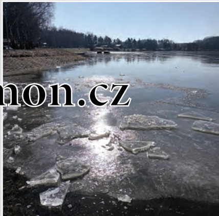
Tající ledy na Velkovřeššovském rybníku budí naději na blížící se předjaří.