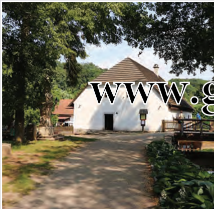
Rudrův mlýn v Babiččině údolí stál již v 16. století. Dodnes se zachovala podoba z roku 1825, kdy byl celý přestavěn. Dosud funkční dvě mlýnská kola jsou poháněna náhonem z Úpy.