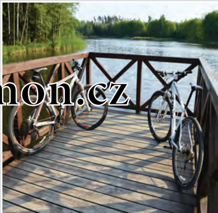
Rybník Datlík byl založen v roce 1898 na místě vysušeného rybníka z 15. století. Dubová alej na hrázi byla vysázena na začátku 20. století. Dnes je vyhledávaným turistickým cílem v hradeckých lesích.