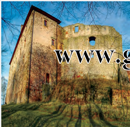
Raně gotický hrad Pecka ze 14. století stojí na skalnatém kopci nad stejnojmenným městečkem. Původní hrad nechal v 17. století Kryštof Harant z Polžic a Bezdruzic přestavět na renesanční zámek s hradbami.